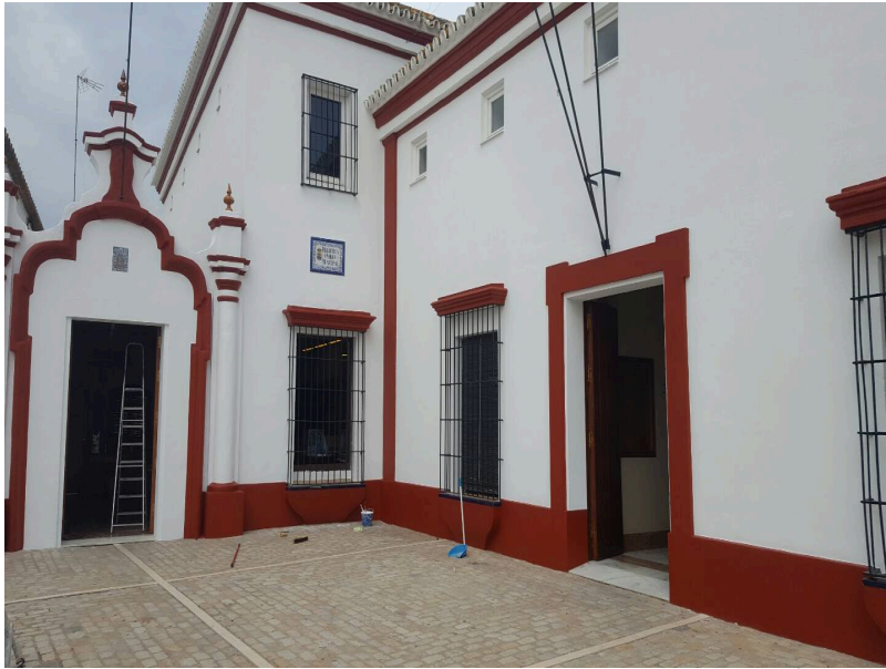
( http://www.villalbadelalcor.es/export/sites/villalba/es/.galleries/noticias/Noticias-2017-4/REHABILITACION-Y-MEJORA-DE-EDIFICIOS-MUN )