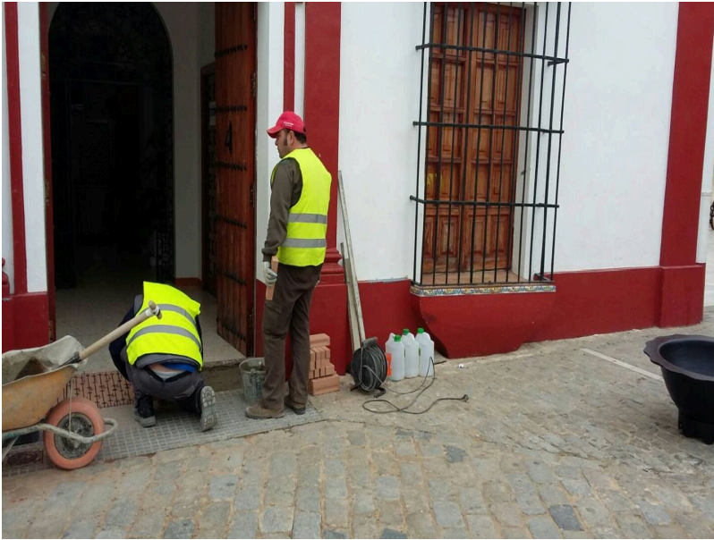
( http://www.villalbadelalcor.es/export/sites/villalba/es/.galleries/noticias/Noticias-2017-4/REHABILITACION-Y-MEJORA-DE-EDIFICIOS-MUN )