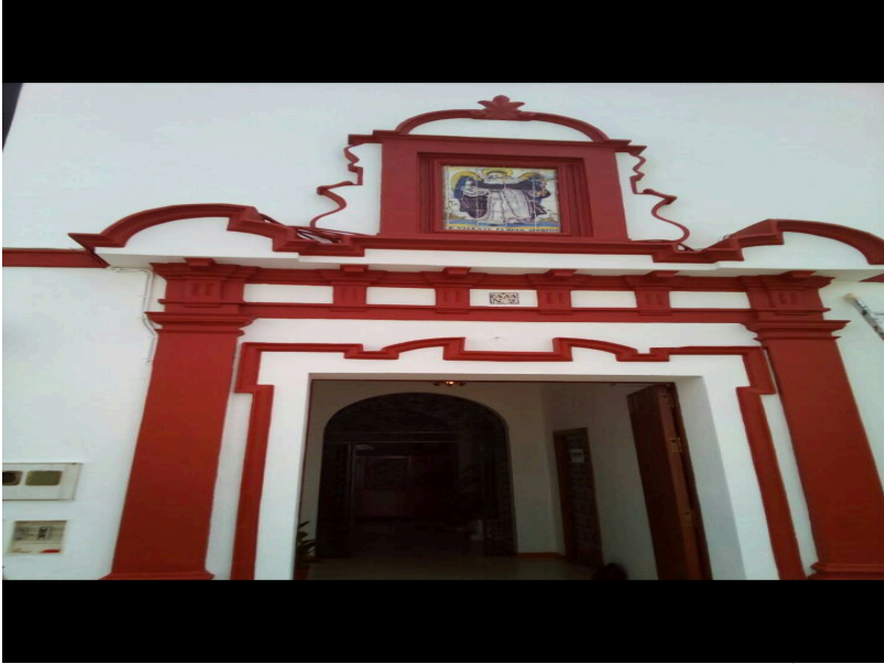
( http://www.villalbadelalcor.es/export/sites/villalba/es/.galleries/noticias/Noticias-2017-4/REHABILITACION-Y-MEJORA-DE-EDIFICIOS-MUN )