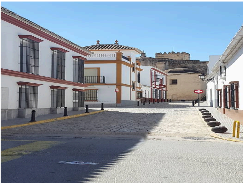
( http://www.villalbadelalcor.es/export/sites/villalba/es/.galleries/noticias/Noticias-2017-4/REHABILITACION-Y-MEJORA-DE-EDIFICIOS-MUN )