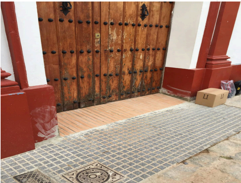
( http://www.villalbadelalcor.es/export/sites/villalba/es/.galleries/noticias/Noticias-2017-4/REHABILITACION-Y-MEJORA-DE-EDIFICIOS-MUN )