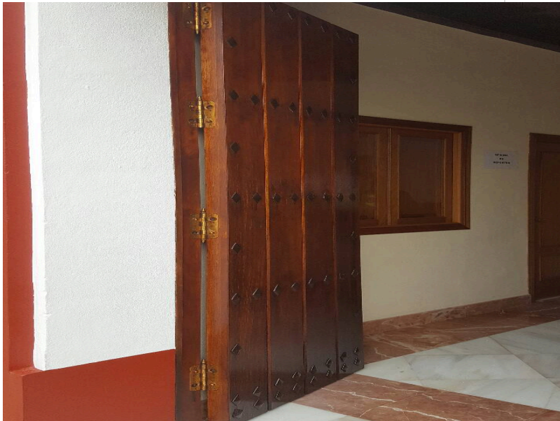
( http://www.villalbadelalcor.es/export/sites/villalba/es/.galleries/noticias/Noticias-2017-4/REHABILITACION-Y-MEJORA-DE-EDIFICIOS-MUN )