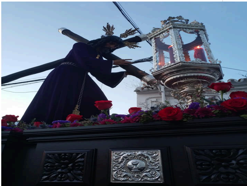
( http://www.villalbadelalcor.es/export/sites/villalba/es/.galleries/noticias/Noticias-2019/Abril/EL-AYUNTAMIENTO-DE-VILLALBA-DEL-ALCOR )