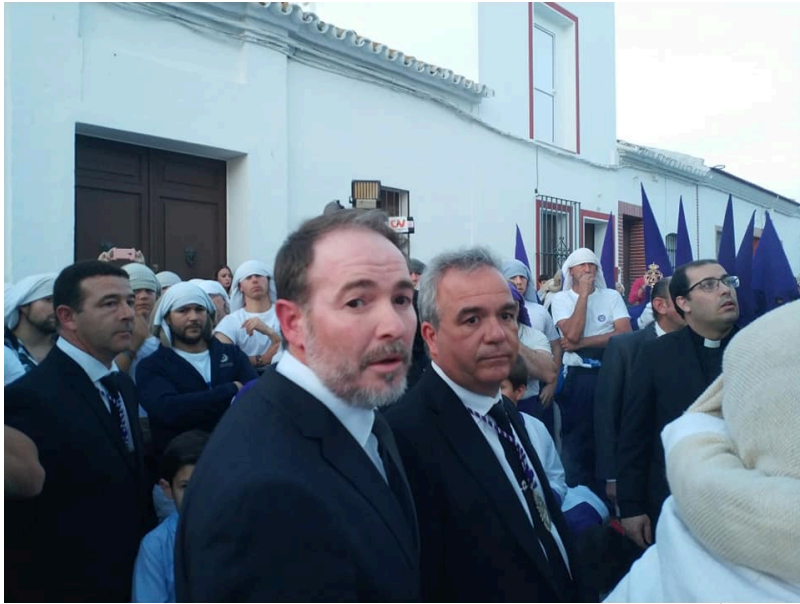
( http://www.villalbadelalcor.es/export/sites/villalba/es/.galleries/noticias/Noticias-2019/Abril/EL-AYUNTAMIENTO-DE-VILLALBA-DEL-ALCOR )