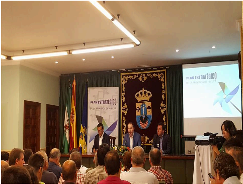
( http://www.villalbadelalcor.es/export/sites/villalba/es/.galleries/imagenes-noticias/JornadasAgricolas1.jpg )