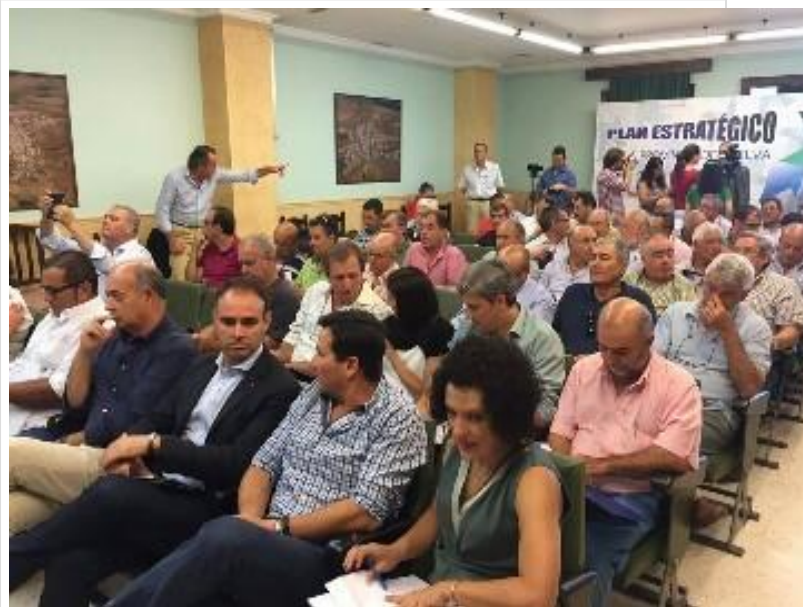
( http://www.villalbadelalcor.es/export/sites/villalba/es/.galleries/imagenes-noticias/JornadasAgricolas2.jpg )