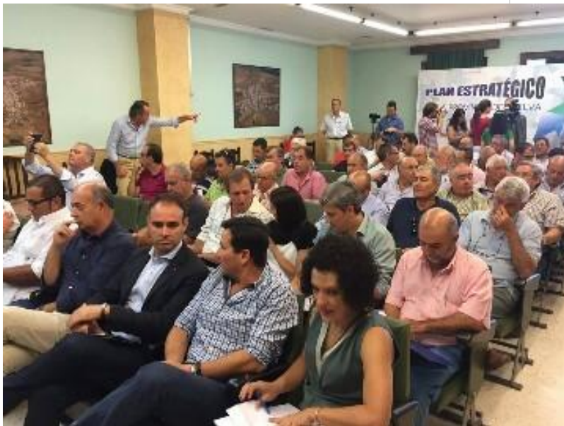
( http://www.villalbadelalcor.es/export/sites/villalba/es/.galleries/imagenes-noticias/JornadasAgricolas2.jpg )