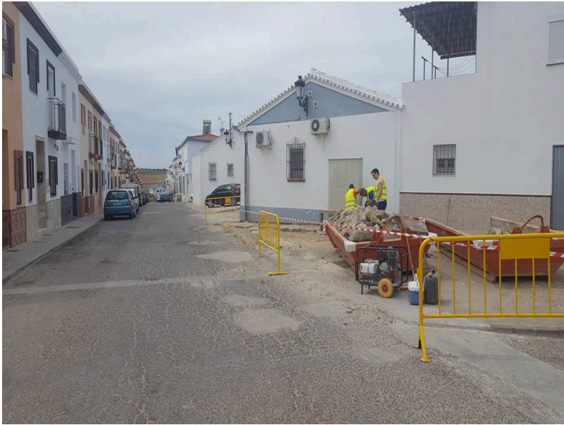
( http://www.villalbadelalcor.es/export/sites/villalba/es/.galleries/noticias/Noticias-2017-8/COMIENZA-EL-PLAN-DE-ASFALTADO-Y-MEJORAS-DE )