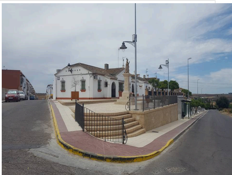
( http://www.villalbadelalcor.es/export/sites/villalba/es/.galleries/noticias/Noticias-2017-8/COMIENZA-EL-PLAN-DE-ASFALTADO-Y-MEJORAS-DE )