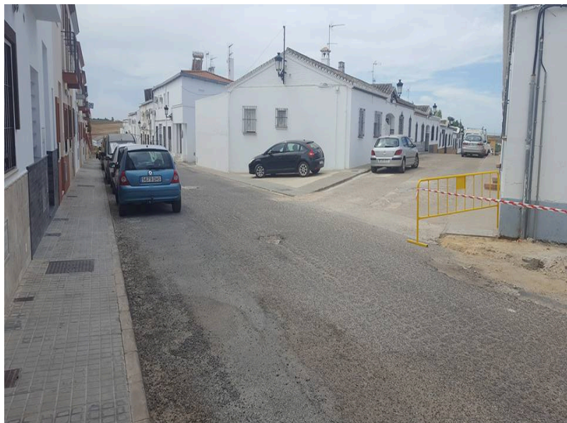
( http://www.villalbadelalcor.es/export/sites/villalba/es/.galleries/noticias/Noticias-2017-8/COMIENZA-EL-PLAN-DE-ASFALTADO-Y-MEJORAS-DE )