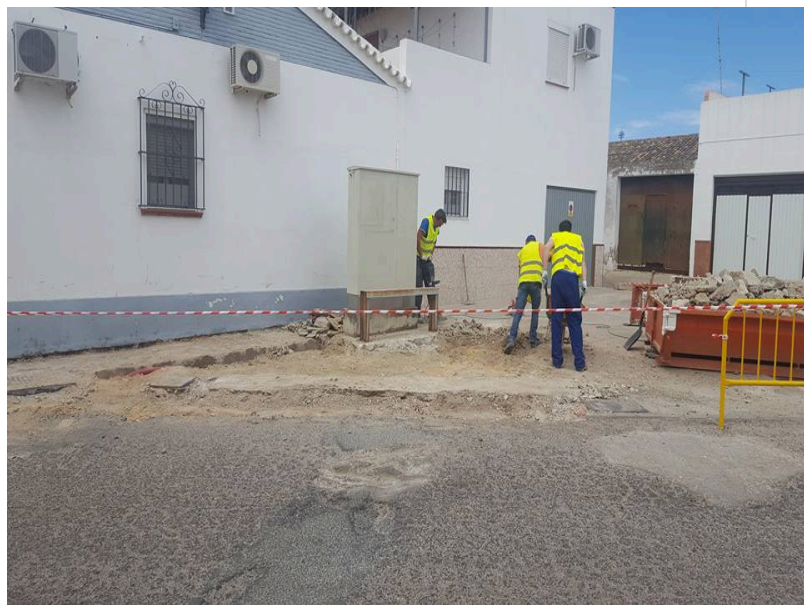
( http://www.villalbadelalcor.es/export/sites/villalba/es/.galleries/noticias/Noticias-2017-8/COMIENZA-EL-PLAN-DE-ASFALTADO-Y-MEJORAS-DE )